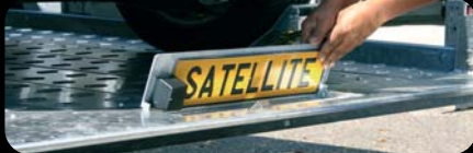
TARGA A SCOMPARSA