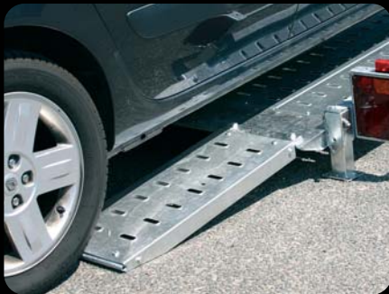
RAMPE VEICOLI RIBASSATI