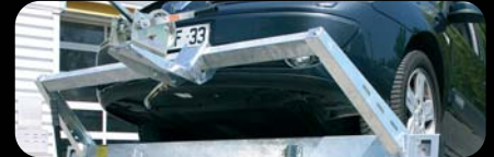
ROLLBAR + ARGANO