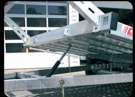
PIANALE INTEGRALE + PISTONE A GAS